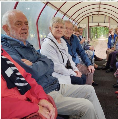
11-09-2025 Streekpuntreis Merksplas